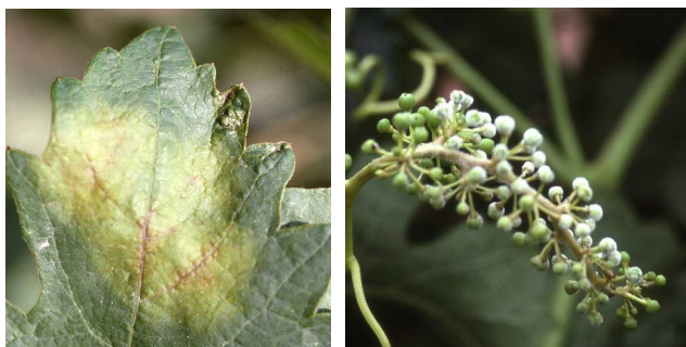
Síntomas de mildiu en hoja y en racimo.

La campaña viene con un notable adelanto, estando iniciándose la floración en Rioja Baja. Se recuerda la importancia de realizar un tratamiento al inicio de la floración , utilizando alguno de los productos indicados en el Boletín nº 11. Este tratamiento se realizará preferentemente con un producto sistémico , mojando muy bien toda la vegetación, con el fin de tener protegido el periodo floración-cuajado, que es muy sensible a esta enfermedad.