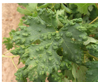
Síntomas de erinosis.