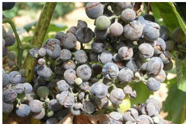
Síntomas de oidio en racimo.

Las condiciones actuales son favorables para el desarrollo de esta enfermedad. Además, el período más sensible a la misma, y que debe estar protegido mediante tratamientos fitosanitarios, es el comprendido entre el inicio de floración y el engorde del grano, por lo que al iniciarse la floración debe realizarse un tratamiento con alguno de los productos indicados en el Boletín nº 10 (o en plena floración si es con azufre en espolvoreo).