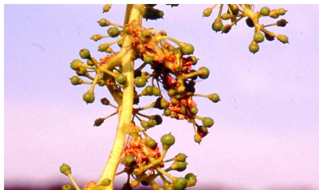
Daños de primera generación de polilla del racimo.

Se está produciendo el vuelo de adultos de la primera generación, estando finalizando en Rioja Baja. Normalmente las larvas procedentes de esta generación no suelen causar daños de importancia en los racimos, excepto en la variedad Garnacha que pueden producir un mal cuajado si la población es alta (el presente año las poblaciones son en general bajas, debido a las condiciones climáticas). Es más alarmante el aspecto que presenta un racimo atacado que los daños que sufre. Por tanto, no se recomienda realizar tratamientos para esta generación , salvo en parcelas problemáticas.