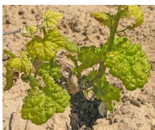
Síntomas de acariosis.

Se observa en numerosos viñedos la presencia de estos ácaros eriófidos, principalmente de erinosis, por lo que se recomienda vigilarlos y realizar tratamientos en caso necesario con azufre en espolvoreo o un acaricida autorizado.